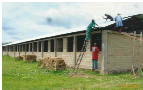
Futur bâtiment scolaire à Nioki – ouverture prévue en septembre 2015

Aide aux étudiants ayant très peu de ressources financières pour un montant de 328 €. Cette aide a permis de donner un complément pour payer des frais académiques à 9 étudiants (287 €), achats de quelques cours polycopiés à 2 étudiants (25 €), soins médicaux à 1 étudiant (16 €).